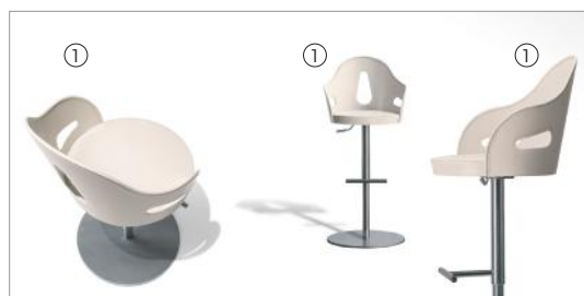
1 Dora 50012 saddle leather milky